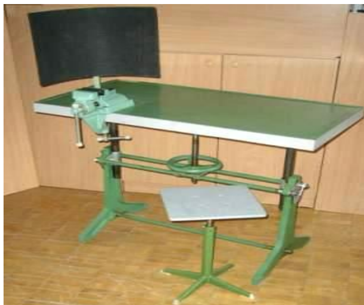
Рис. 1. Слюсарний верстак, що регулюється по висоті

У практиці роботи шкіл зустріти спеціальні конструкції слюсарних і столярних верстаків (від нім. werkstatt – майстерня). Слюсарний верстак, який використовується в багатьох школах, призначений для виконання учнями слюсарних і електромонтажних робіт (рис. 1). Його також можна використовувати як стіл для конспектування пояснень учителя і виконання графічних робіт. Для цього лещата встановлюють трохи лівіше від середини кришки верстака. При проведенні електромонтажних робіт лещата з верстака знімають і прибирають у лівий ящик. Верстак має мати підйомний пристрій для регулювання висоти кришки разом з лещатами, що дає змогу змінювати висоту верстака від 730 до 1000 мм.