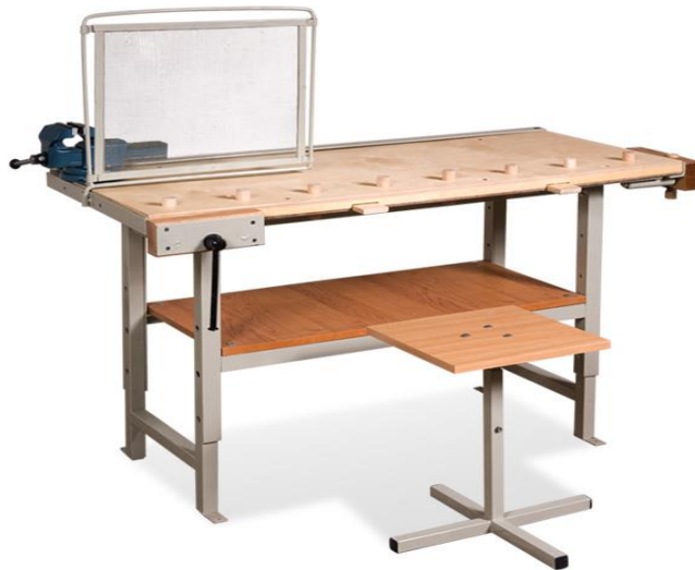
Рис. 3. Комбінований учнівський верстак

У майстернях для обробки деревини встановлюють токарні марки СТД-120 і пиляльно-стругальні (ФПШ-5) верстати, а для обробки металів – токарно-гвинторізальні (ТВ-6, ТВ-7) та свердлильні верстати. Токарно-гвинторізальні верстати мають невелику висоту центрів – до 150-160 мм і відстань між центрами – 600-800 мм. Свердлильні верстати повинні мати найбільший діаметр свердління – 12 мм. Для шкільних майстерень випускають спеціальні фрезерні верстати марки НГФ-110 Ш4. Для заточування різальних інструментів установлюють заточувальні верстати (наждачні точила).